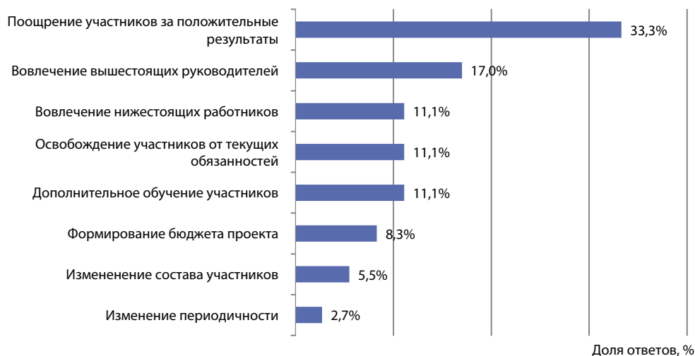
Рис. 4. Оценка важности направлений повышения результативности разработки и реализации организационно-технологических проектов в будущем (22 участника проектов, ноябрь 2020 г.)

сокой эффективности организованной проектной деятельности. С другой стороны, полученный эффект составил 41% от потенциального (см. табл. 4), что, безусловно, требует осмысления, дальнейшего анализа и поиска мер по повышению результативности системы управления организационно-технологическими проектами.